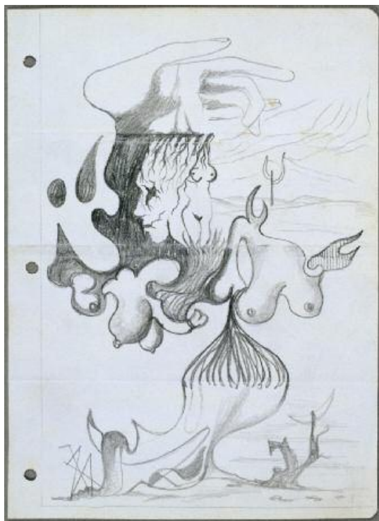
ANTÓNIO PEDRO • CADAVERE EXQUIS • C.1947/48 • JÁPESSY PAVEL • Nº INVENTÁRIO 2479

In http://www.museuartecontemporanea.gov.pt/pt/pecas/ver/337/artists