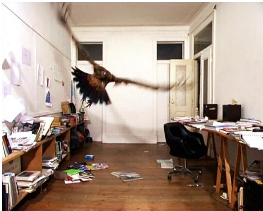
JAGO DRÓFEE • UNTITLED (VULTURE IN THE STUDIO), VIDEO STILL • VIDEO, CCR, SON, 9:38' • SECULO XXI (2001) • 01/11/2015/01/2016

Hito Steyerl, As Artes Cidadãos! To The Arts, Citizens! Vol. 1. 20 de novembro de 2010 a 13 março de 2011. Exposição integrada nas Comemorações do Centenário da República. Fundação de Serralves. Pág. 304.